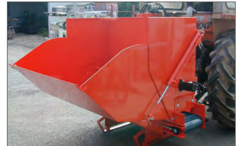
Heckmontage mit 3-Punkt-Aufhängung: einfache Befüllung mit hydraulisch bewegter Ladeklappe