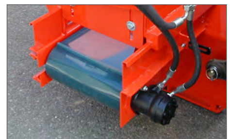
Robustes Querförderband einstellbar für Links- oder Rechtsauswurf mit regulierbarer Einstreu-Wurfweite bis zu 3 m

Kostenloses und unverbindliches Angebot! Jetzt anfordern!