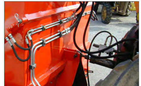
Schnelle Installation: einfach wirkender Hydraulikanschluss mit freiem Rücklauf genügt